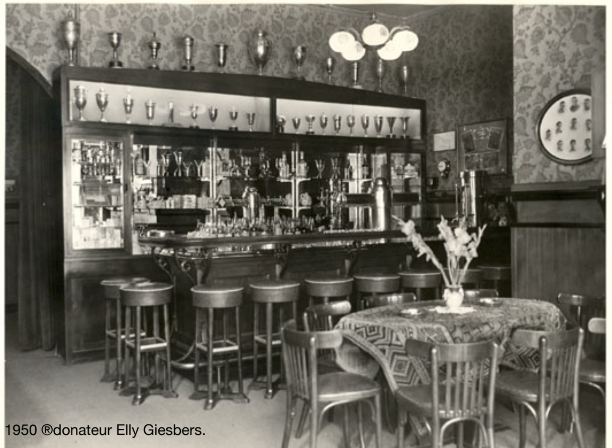
1950 @donateur Elly Giesbers.