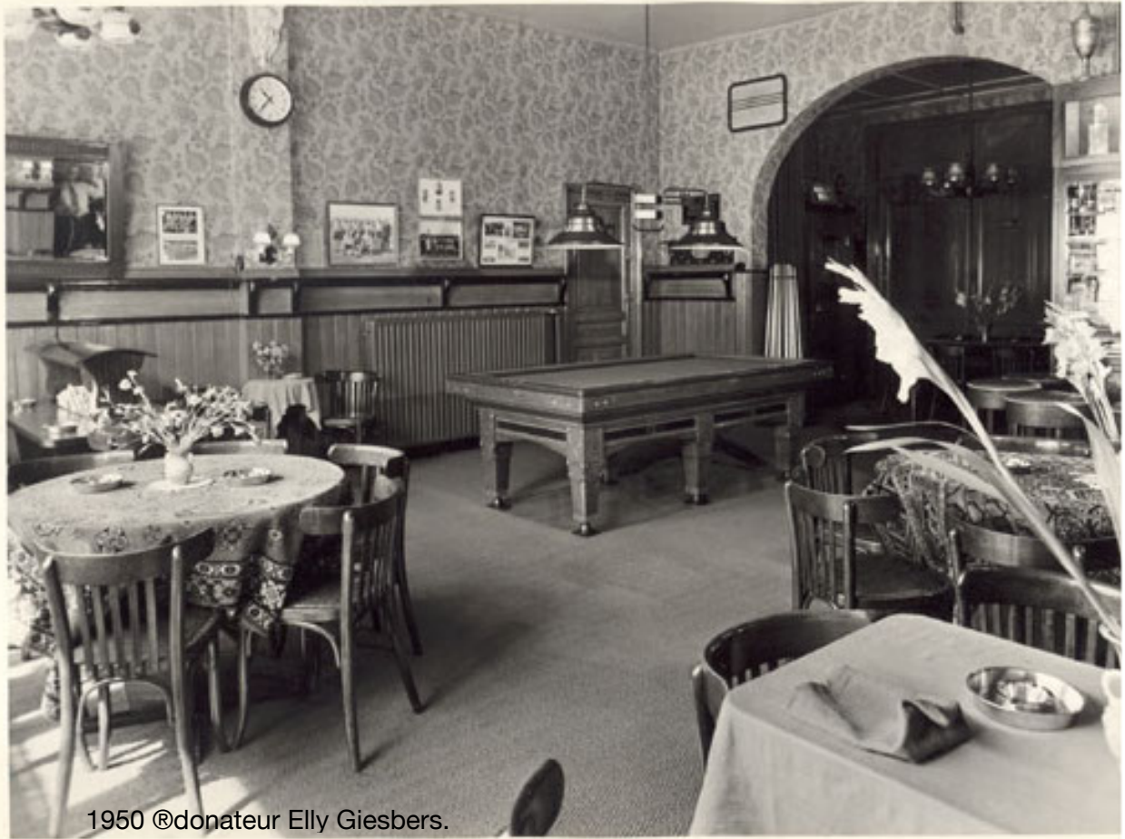
1950 @donateur Elly Giesbers.